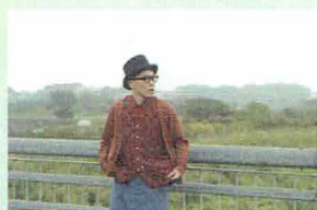
永積 崇 (ハナレグミ) 12/28